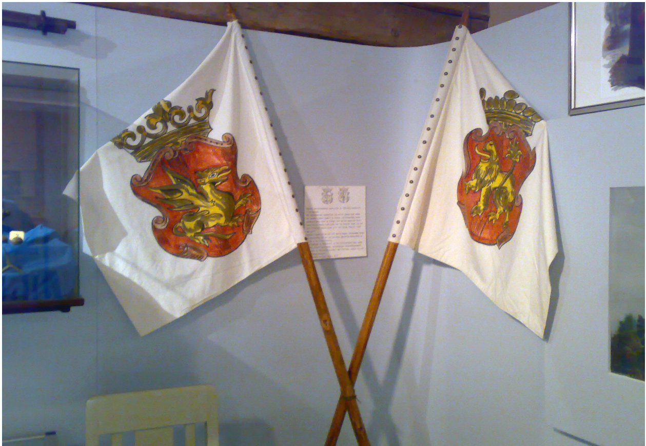
Från Garnisonsmuseet i Linköping 2014