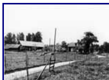
Henning Bergs Ängstorp