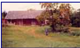
Från Thore Ardell