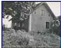
Från Thore Ardell