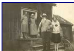
Gubben Djärv, Snårbacken