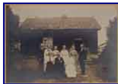
Från bröderna Asplunder